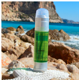
Rocarahair - Zoom- 5-Star Jabber Gel