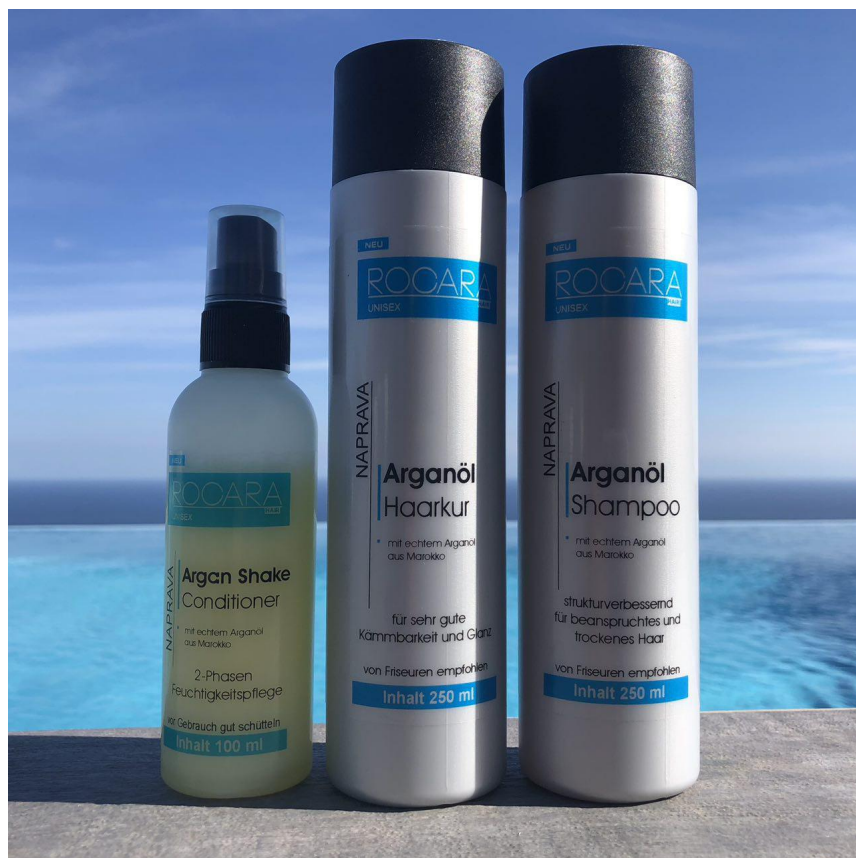
Rocarhair Naprava Argan Power Set