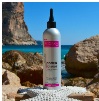
Rocarhair - Coffein Tonikum for Women