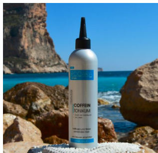
Rocarahair - Coffein Tonikum for Men