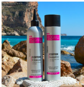
Rocarhair - Coffein Set for Women