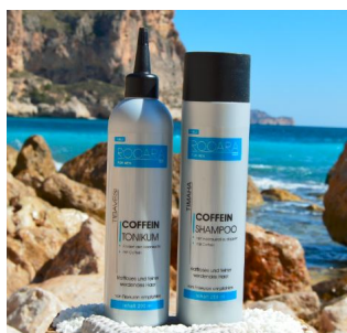
Rocarhair - Coffein Set for Men