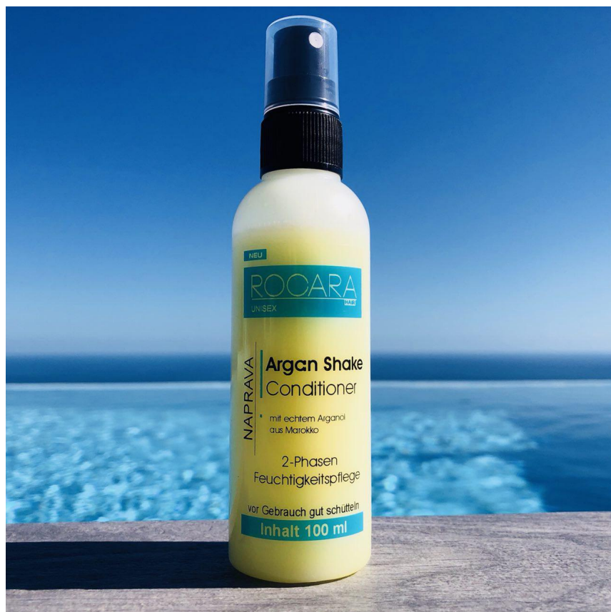
Rocarhair - Arganöl Kur