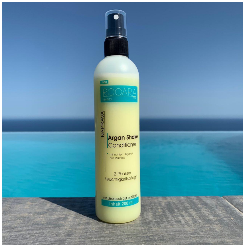
Rocarhair - Arganöl Kur